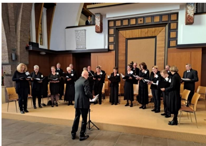
AVE tijdens een Choral Evensong in Sliedrecht in 2022.

In de loop der eeuwen is er ontzettend veel muziek voor deze Engelse koortraditie geschreven. Hierdoor klinkt de vaste orde van dienst elke keer weer totaal anders: van gregoriaans tot modern, soms a capella, soms met orgelbegeleiding. In Britse kathedralen en universiteitscolleges wordt de Choral Evensong nog steeds dagelijks gezongen. "Bent u niet in de gelegenheid om te komen, dan is de dienst ook te volgen via kerkdienstmeebelevan.nu . Bij de uitgang zal ter bestrijding van de kosten een vrijwillige gift worden gevraagd.